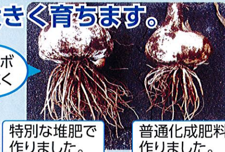
特別な堆肥で作りました。