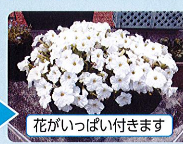
花がいっぱい付きます